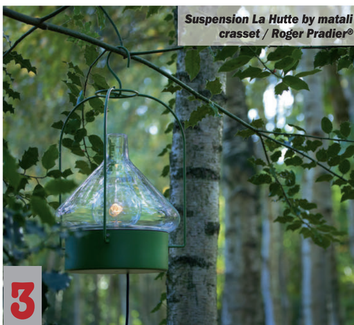
Suspension La Hutte by matali crasset / Roger Pradier®